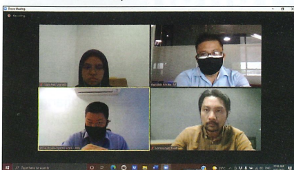
Sesi Temu bual Secara RAKAN Sarawak bersama Pengarah Jabatan Perkhidmatan Pembedahan Sarawak