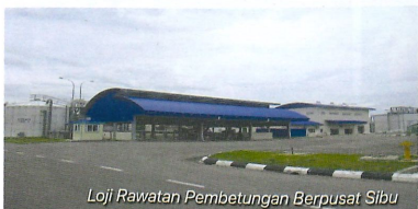
Loji Rawatan Pembedahan Berpusat Sibu

Mekanisme tersebut semuanya bertujuan untuk mengurangkan kejadian pembedahan yang tersumbat. Bagi Sistem Kuching, pihaknya menetapkan Indeks Petunjuk Prestasi (KPI) kepada 12 kes penyumbatan pembedahan awam dalam setahun.