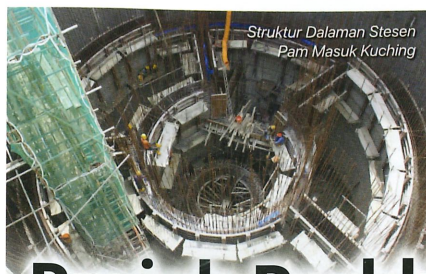
Struktur Dalam Stesen Pam Masuk Kuching

Jelasnya lagi pihaknya juga telah melengkapkan dokumentasi reka bentuk dan tender sejak beberapa tahun kebelakangan ini untuk empat (4) loji rawatan enapcemar septik; iaitu di Limbang, Kapit, Sarikei dan Betong dengan pembinaan akan dimulakan sebaik sahaja peruntukan penuh disediakan.