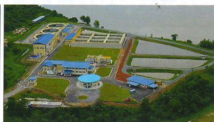
Loji Rawatan Pembedahan Berpusat Kuching