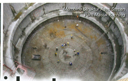
Membina Struktur Asas Stesen Pam Masuk Kuching